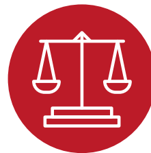
Cymru Fwy Cyfartal